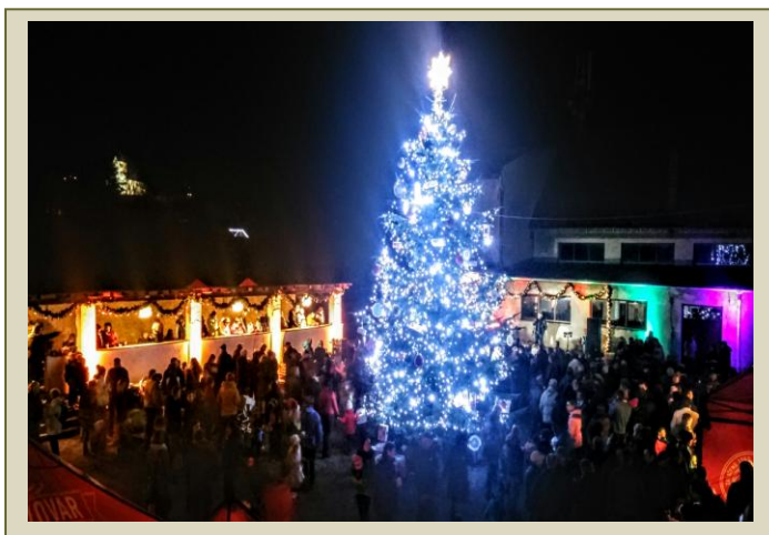
Babické Vánoce 2017 za sokolovnou

Babičtí sokolové se loni vyznamenali. Na sokolské zahradě v místech, kde v době hodů stojí mája, postavili vánoční strom o výšce 10 metrů. Světelnou výzdobu provedl odborník, který nasvěcuje vánoční stromy v Brně a bylo se při vlastním aktu skutečně na co dívat.