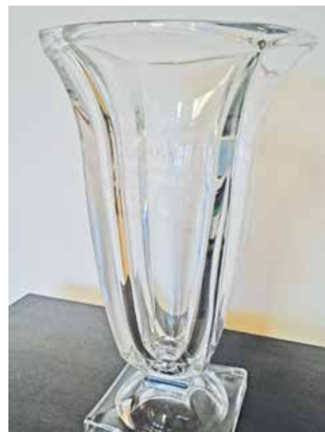
Putovní pohár „Babičák“