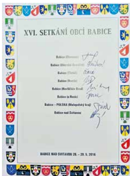
Prezenční listina zástupců obcí