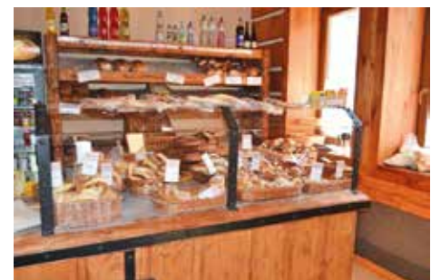
Prodejna v bílovičské pekárně

Rozhovor připravila Mgr. Martina Schořiková