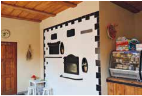
Historická parní pec

Přejděme k výrobě té nejzákladnější potraviny, kterou se spolu se solí vítali hosté (protože tato potravina byla vždy v domě) a později i celé delegace státníků© Jaké je složení chleba a jak chléb vzniká?