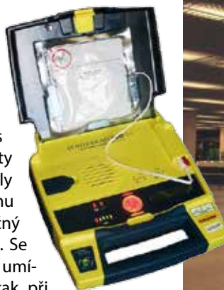
Ilustrační foto – defibrilátor

Snad každý z Vás zažil nekončící nálety vos, které se zahnízdily někde v podbití domu a tím ukončily bezpečný pobyt např. na terase. Se správným vybavením umíme pomoci. Stejně tak při jímání včelích