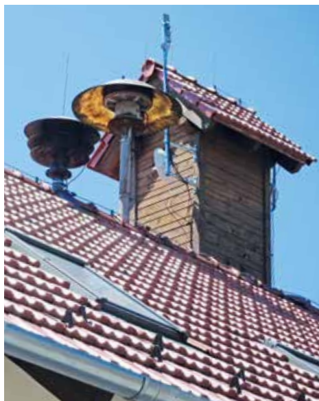
Siréna na babické „hasičce“

Při úvaze o náplni tohoto článku jsem se rozhodl Vás, své spoluobčany, seznámit s nejčastějšími výjezdy naší jednotky. Vždy, když se rozezní siréna (tedy kromě 12:00 první středy v měsíci, kdy probíhá zkouška sirén), všeho doma rychle nechám, obléknu, co mám zrovna po ruce a běžím do zbrojnice. Po cestě často dostávám dotazy, kam že to vlastně jedeme, a většinou ani nestíhám odpovídat. Proto tedy nyní svoji chybu napravuji.